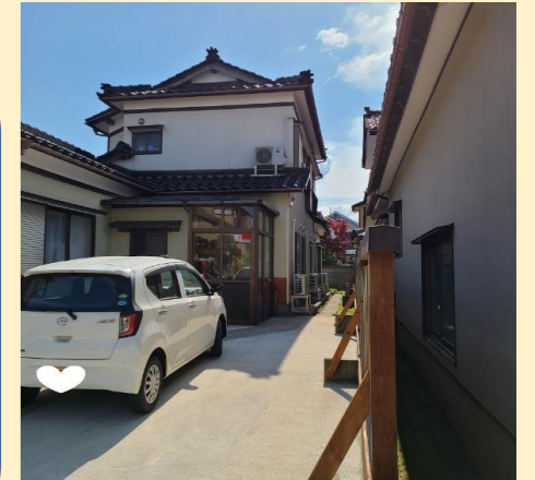
グループホーム「ポプラ」外観

3カ月ごとに外食レクを行っています。コロナ禍の為、現在はテイクアウトでの食事提供になっています。