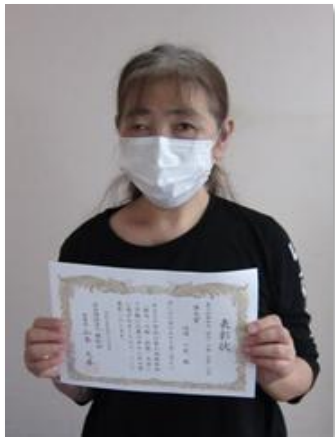
準大賞を受賞した魚の子供さん