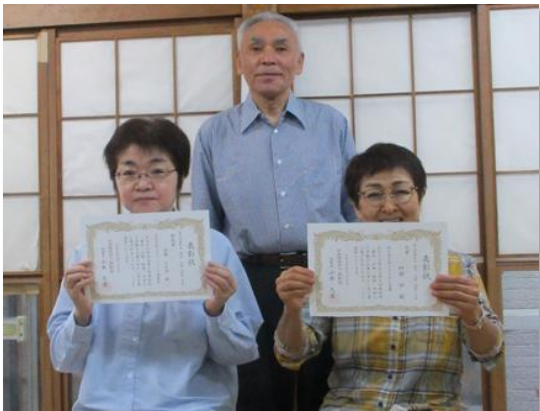
大賞を受賞したこうさん（右）と、特別賞を受賞したさ・ささん（左）（中央は理事長）